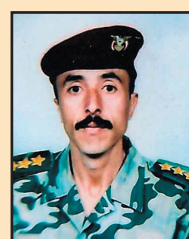
محمد محمد محمد