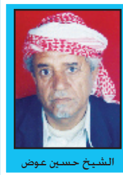
الشيخ حسين عوض